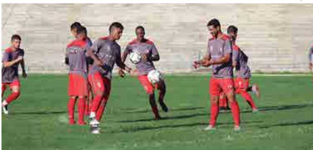
O Campinense recebeu com otimismo a definição do seu grupo e espera a ascensão para a Série C de 2019

O Galo estreia fora de casa contra o Vitória da Conquista-BA, enquanto a Raposa terá pela frente o Fluminense de Feira de Santana-BA, no Amigão, nos dias 21 ou 22