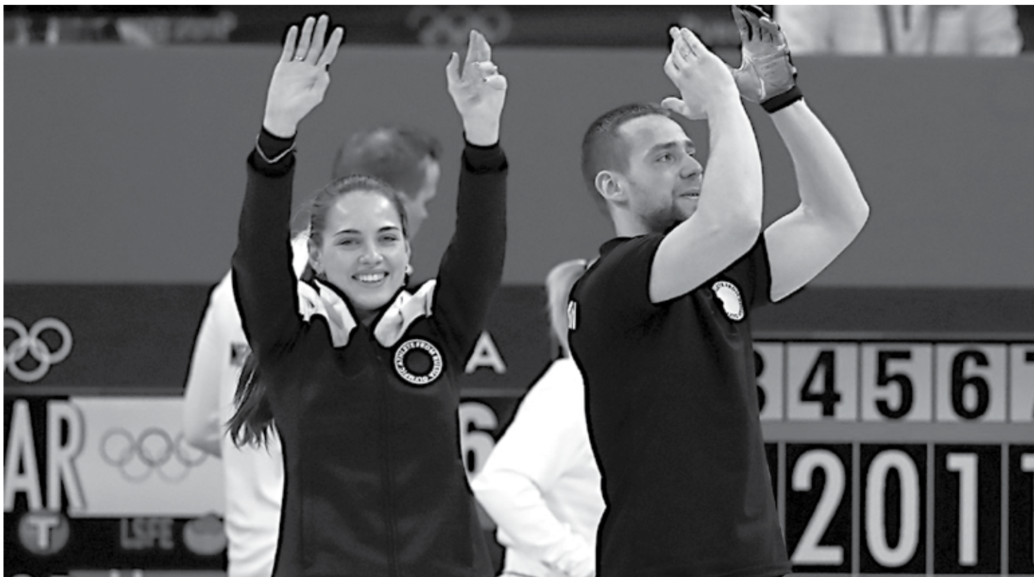
Aleksandr Krushelnitskiy e a esposa Anastasia Bryzgalova mancharam ainda mais a Rússia nos Jogos de Inverno na Coreia do Sul ao serem flagrados no doping