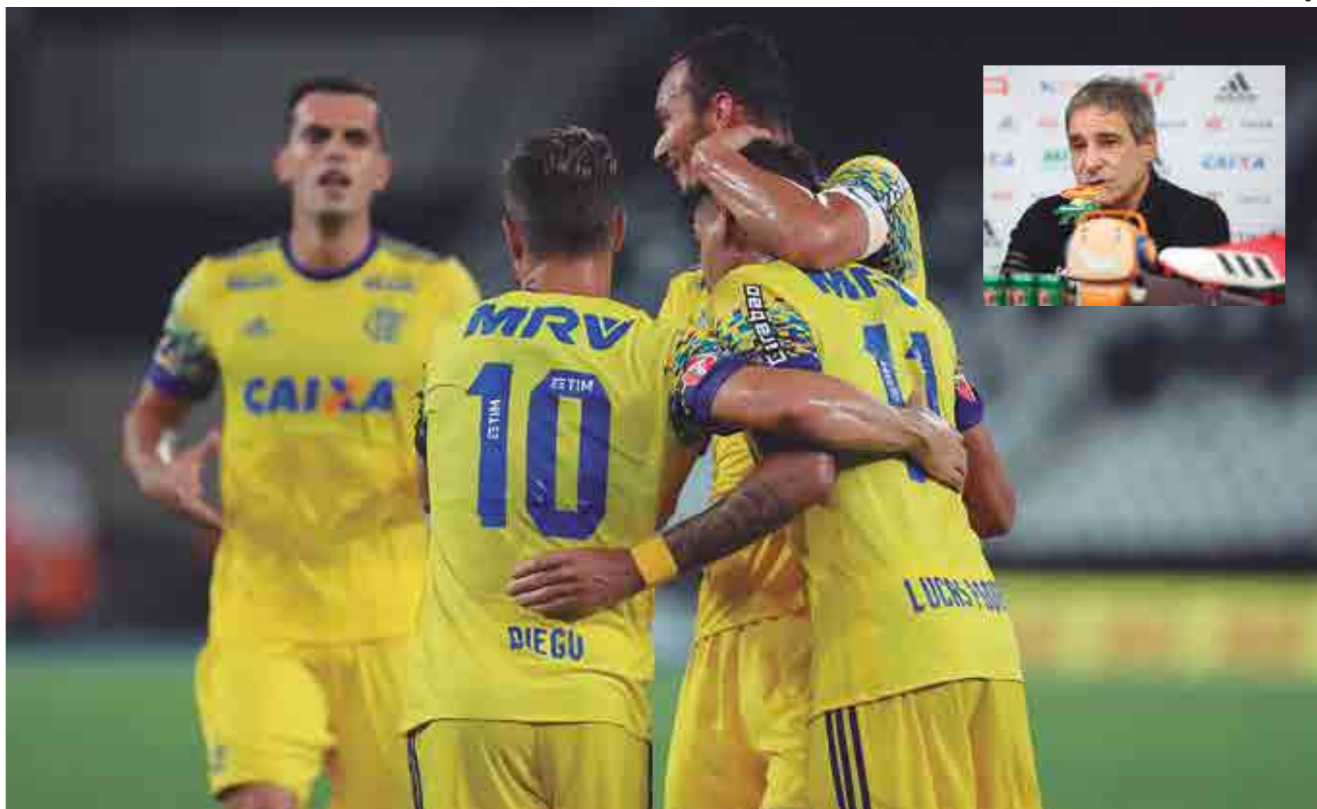
O técnico Paulo Cesar Carpegiani, no detalhe, já decidiu que os titulares serão poupados no clássico diante do Fluminense pela Taça Rio, jogo que vai acontecer longe do Rio de Janeiro amanhã