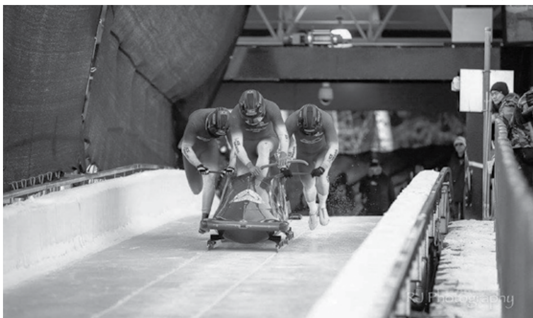
Equipe brasileira mostrou boa performance nos treinamentos antes da estreia que acontece hoje na Coreia

A competição do 4-man será realizada em quatro baterias. A soma dos tempos define os vencedores. Hoje a partir das 21h30 (do Brasil), serão realizadas as duas primeiras baterias. Amanhã, no mesmo horário, começam as duas baterias finais. Porém, dos 30 trenós que começam a disputa, apenas 20 participam da quarta e última descida. A melhor colocação do bosbled brasileiro em Jogos Olímpicos foi a 25ª, em Turim 2006.