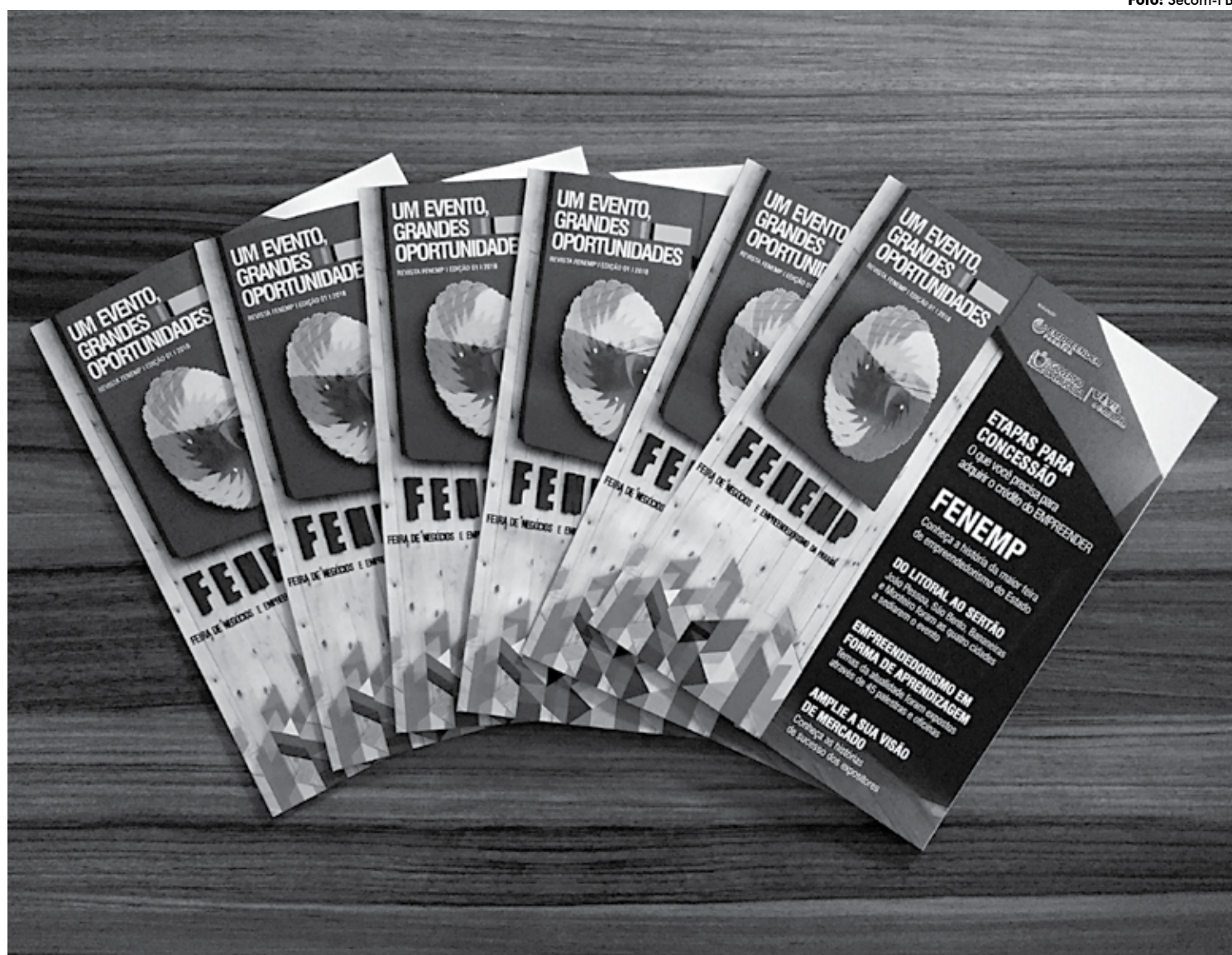
Os exemplares da revista serão distribuídos nas próximas edições do ciclo do Orçamento Democrático 2018, nas capacitações realizadas pelo Empreender

A distribuição será gratuita e os interessados também poderão ter acesso ao material comparecendo à sede em João Pessoa, localizada na Av. Barão de Mamanguape, 1190, Torre, bem como nos postos de atendimento do programa em Bananeiras, Patos e Itaporanga.