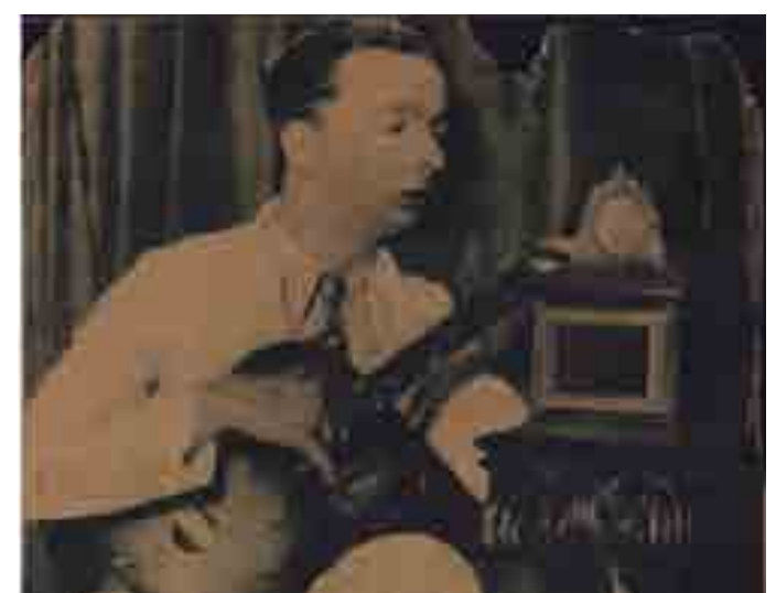
Programa revisita a obra do compositor depois de 80 anos da sua morte