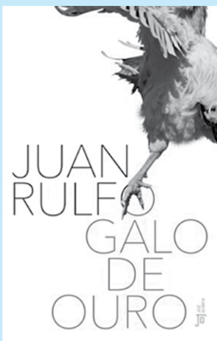
Capa da obra lançada pela Editora José Olympio

Na trama, depois de uma disputa de rinha de galos, a vida de Dionisio Pinzón muda completamente. Ao decidir salvar um galo moribundo, o homem miserável fica