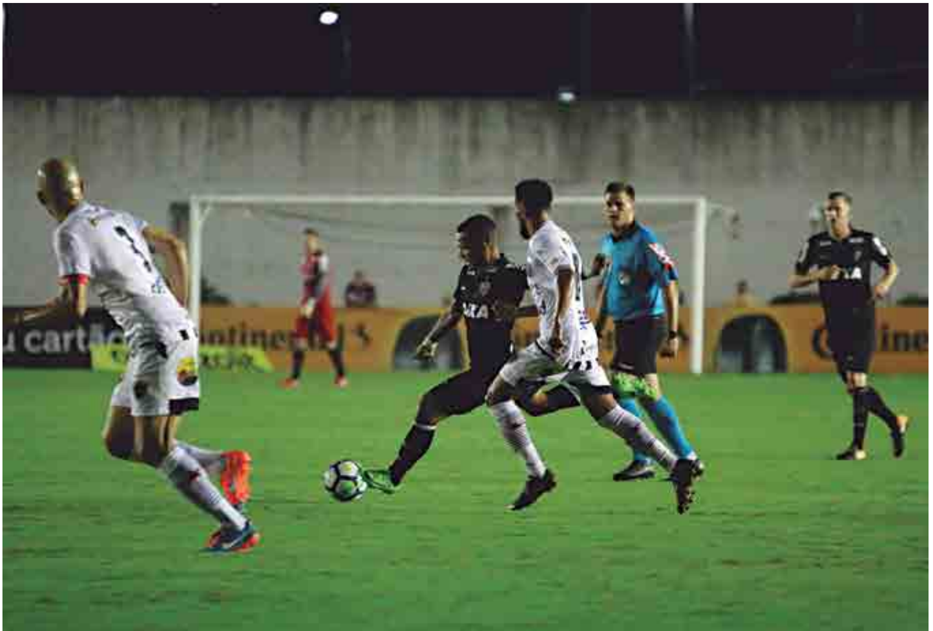
Iludido com a boa campanha neste início de temporada, o Botafogo partiu para cima do Atlético Mineiro, e foi surpreendido pela rapidez e eficiência dos contra-ataques do Galo de Minas Gerais